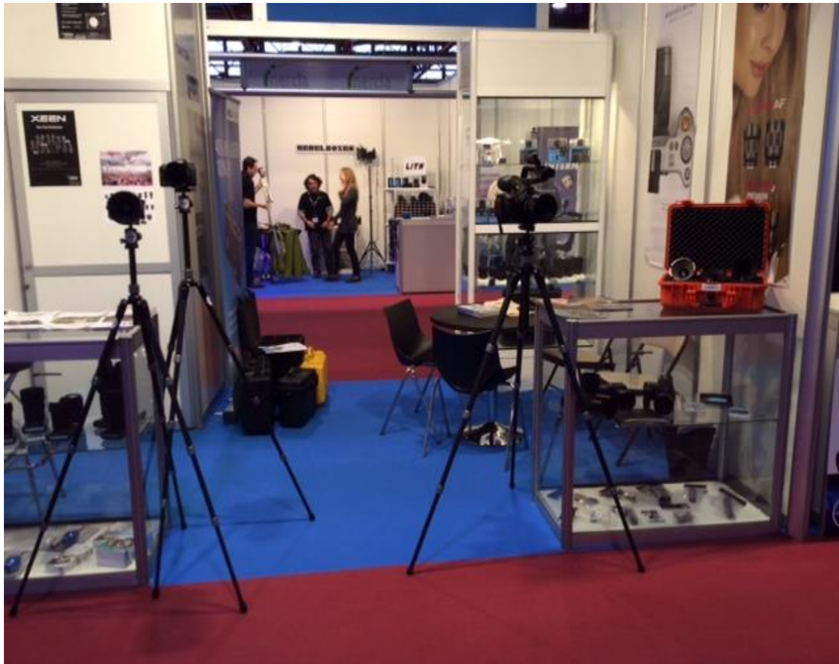
BITAM 2016 Salón Internacional de Broadcast, IT, video y audio.