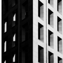
Architecture: Kamilla Hanapova