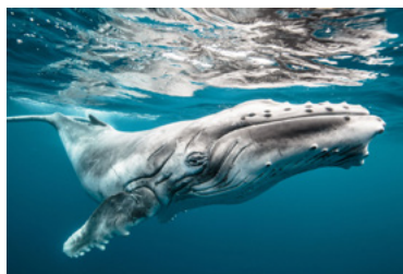
Wildlife: Karim Iliya