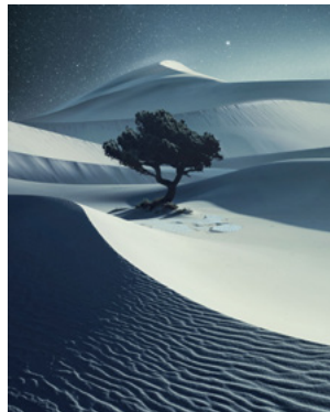
Landscape: Benjamin Everett